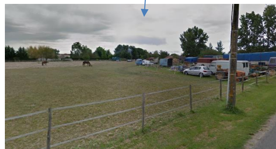
Zone 1AU de la Grand-Place