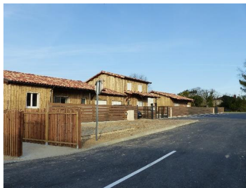
Lotissement récent au Sud de la mairie, qui peut servir de modèle