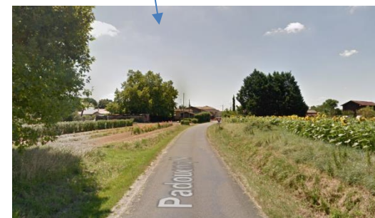
La zone 1AU de Padouing Nord